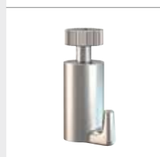
CROCHET AUTOBLOQUANT Maximum 15 kg