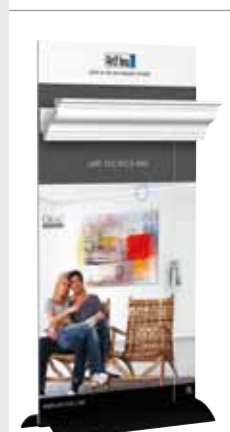
DESK DISPLAY DECO-RAIL 21 x 40 cm