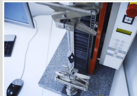
exemple de résultats d'essai Micro Grip